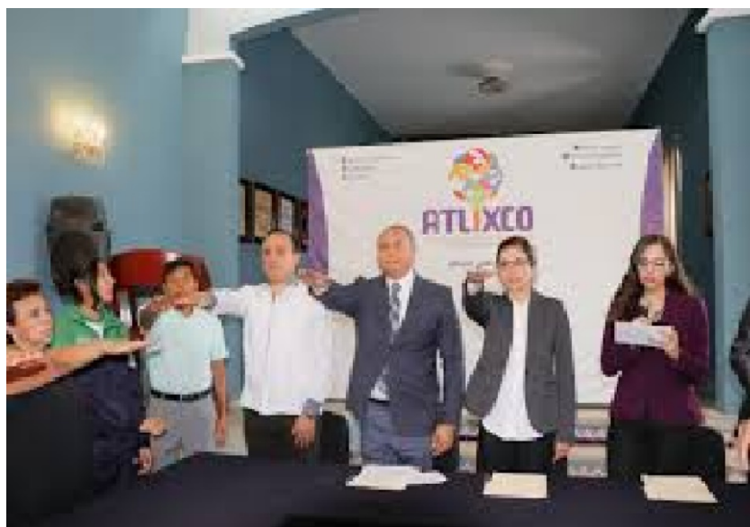
Toma de protesta de la conformación del Comité Municipal para la Prevención de Embarazo en Adolescentes del Municipio de Atlixco, 31 de octubre de 2019.

Sin embargo, el Consejo Estatal de Población, ha logrado entablar comunicación y unión con los Ayuntamientos, en el cual hemos asistido a Municipios que muestran un gran interés en la Prevención de Embarazos en Niñas, Niños y Adolescentes, como se muestra en la evidencia fotográfica que antecede, tomada en el Municipio de Atlixco, Puebla.